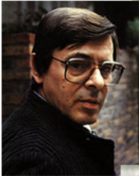
José Angel Valente