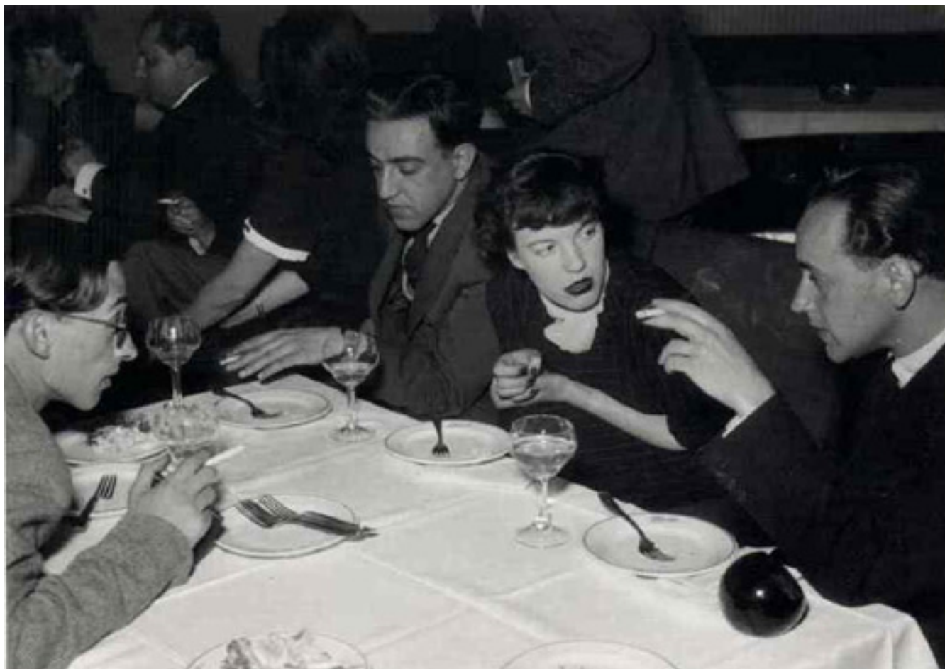
Ingeborg Bachmann e Paul Celan