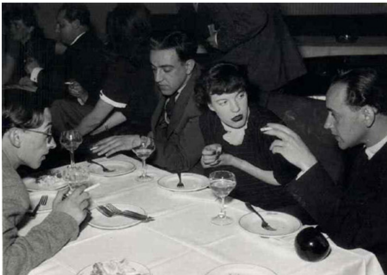
Ingeborg Bachmann e Paul Celan